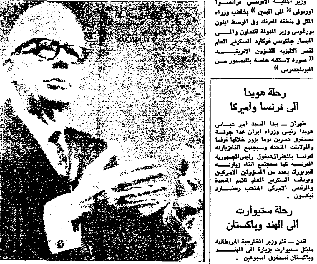
وزير الخارجية الفرنسي فرانسوا فونسي (اليمين) يخاطب وزراء المال في منطقة الفرنك والوسط افرون بورغوس وزير الدولة للتعلمون والسياسات الخارجية فيكتور فونكارد السنكر العام لفرانسوا فونسي للثلاثون الاثني عشر

رحلة هويدا الى فرنسا وامريكا هوانا - بدأ السيد امير عباس هويدا وزير ووزير ايران هذا جولة مستغرقة حشرين يوما بزور خلالها فرنسا والمملكة المتحدة وسويسرا والنرويج والبرتغال والجزائر ليعتقد ان سبب الزيارة هو فهم المشاكل الدولية وحديث العلاقات التجارية والثقافية ودراسة موضوعات رابطة الشعوب البريطانية التي سبقت في لندن خلال شهر كانون الثاني المثلث من الزميين الاميركيين سيديان عند رغبة في حضور المؤتمر واصل ان يفتق رئيس الاميركيان ورئيس وزراء الهند من الاشتراك في المؤتمر لانه من الصعب عملا ان تقوم بتمثيل تاريخي مناسب لاجل رئيس دولة بلان من سنة كما كان الحال في السابق وقال ان مشكلة الهجرة من دول الكومونولث الى بريطانيا سبغت ايضا خلال هذه الرحلة لتها قضية نهم جميع دول الكومونولث .